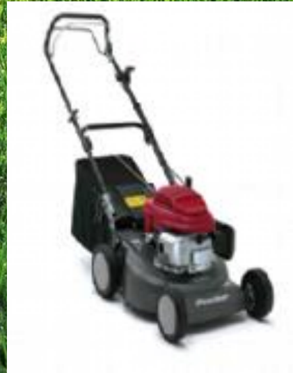
HONDA JRG 465 CSX

Mit 4,5 PS OHC Honda 4-Takt-Motor 46 cm Schnittbreite Stahlblechgehäuse 5-fache Höhenverstellung Grasfangsack