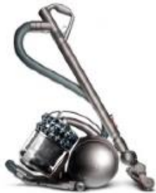
DC52 Animal Turbine