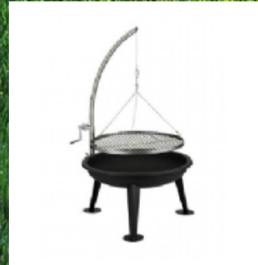
STIHL Motorsense FS 55