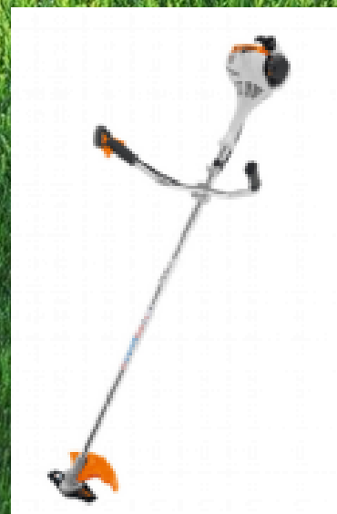
STIHL Motorsense FS 55