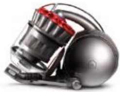
DC33c Origin Plus