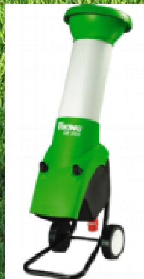
VIKING Gartenhäcksler GE 345