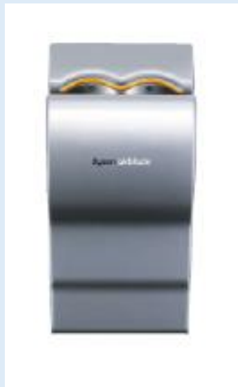
Dyson Airblade Aluminium