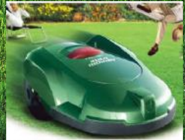
HUSQVARNA Auto Mower