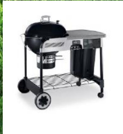
Morderner Kugelgrill „Space“