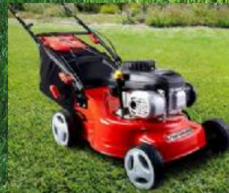
FLYMO L 400