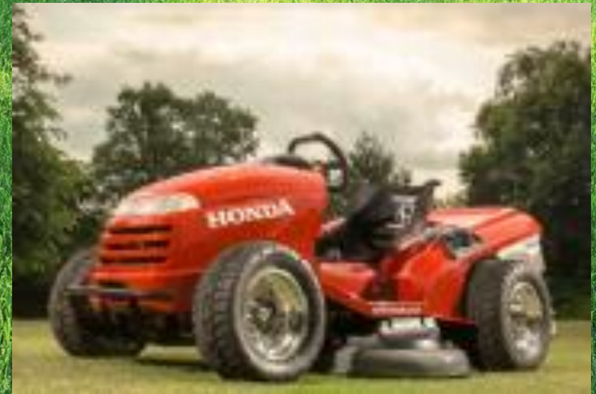
HONDA Aufsitzmäher HF 122 S